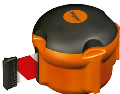
D170.000 Unidad Skipper XS