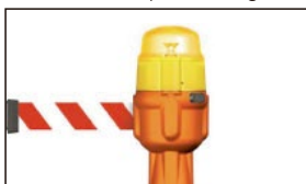
D160.000 Unidad Sin Cinta SK