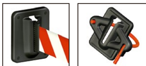
D170.003 Receptor Cuerda Magnético XS