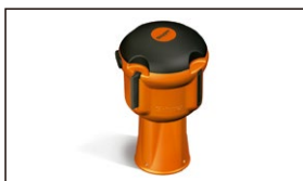
D165.000 Soporte Pared SK