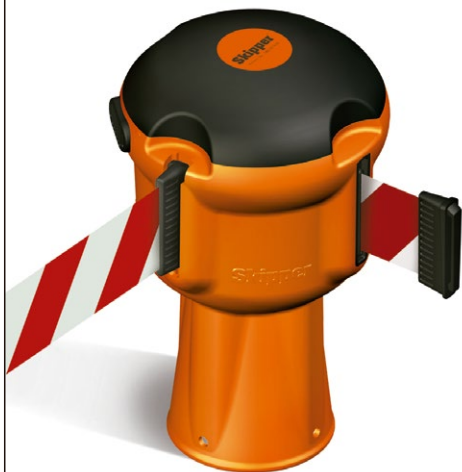
D150.000 Cinta Retráctil Unidad Skipper SK