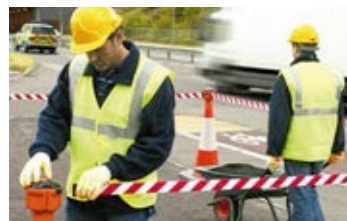
D150.001 Lámpara Recargable