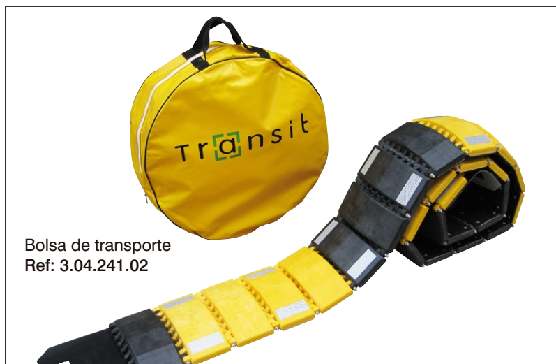
Bolsa de transporte Ref: 3.04.241.02